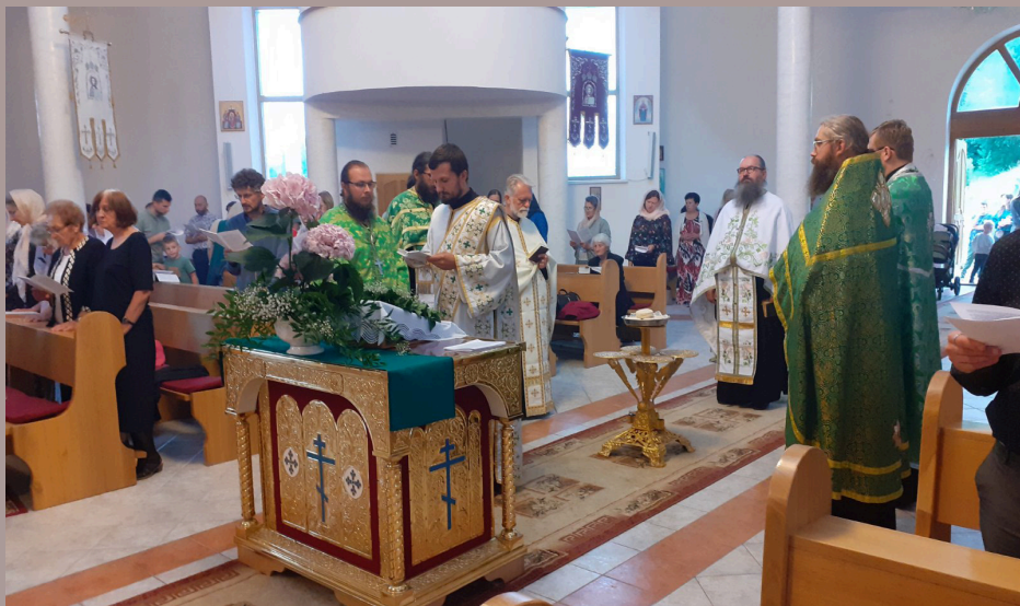
Oslavy chrámového sviatku sv. Serafima Sarovského v Bardejove