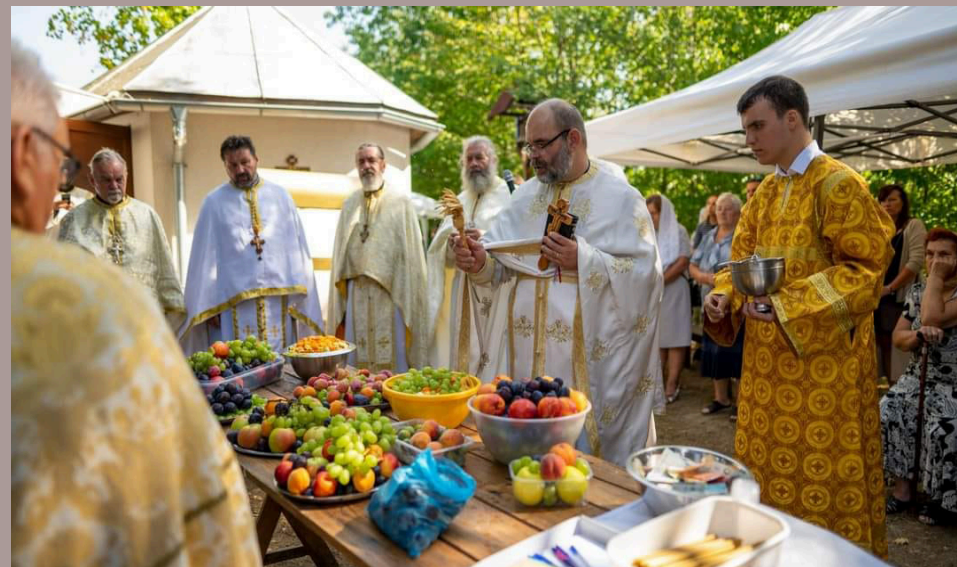
Oslavy sviatku Preobrazenia Isusa Christa v Uličskom Krivom. Posvätenie ovocia