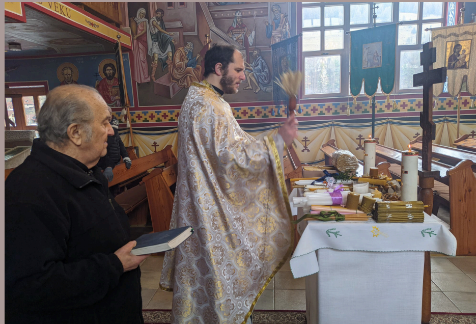
Posvätenie sviečok na sviatok Stretnutia Isusa Christa v chráme Vznesenia Isusa Christa v Slovinkách