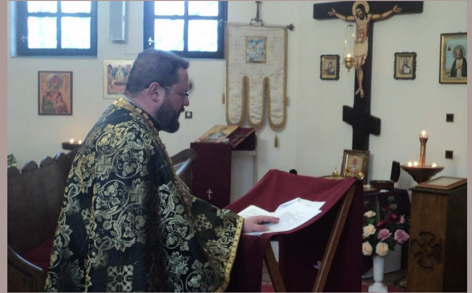
Veľký kajúčny kánon sv. Andreja Krétskeho v 1. týždni Veľkého pôstu v chráme Zosnutia Presvätej Bohorodičky v Nižnej Rybnici