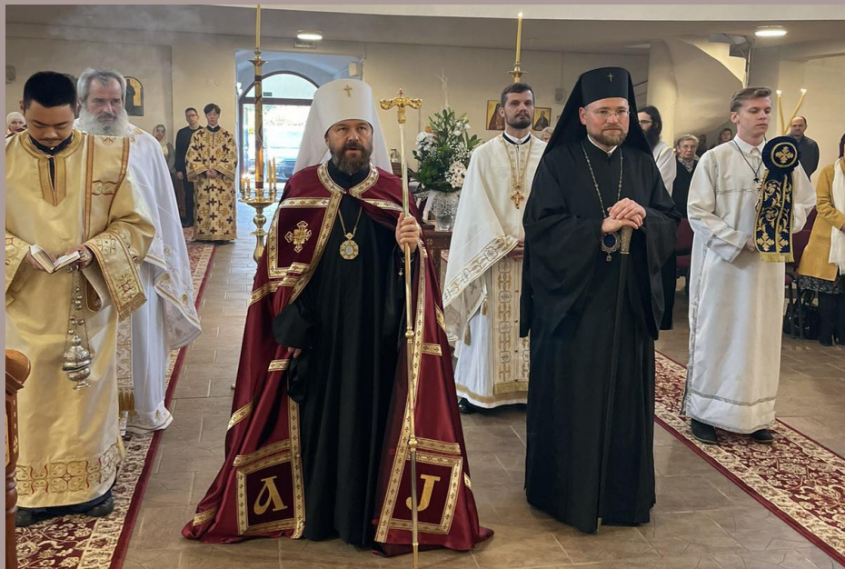
Archijerejská sv. Liturgia na sviatok sv. Jána Milostivého, alexandrijského patriarchu, v košickej katedrále