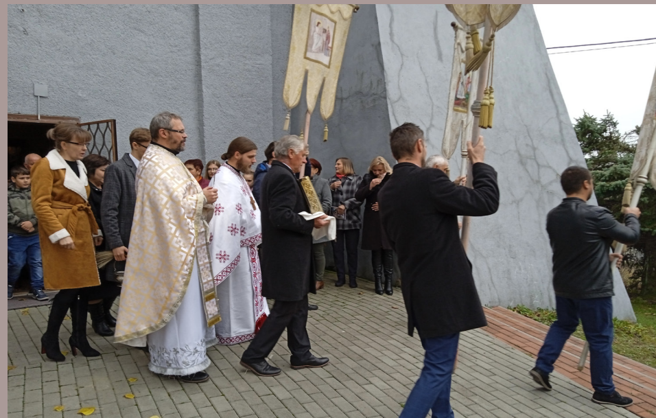
Oslavy chrámového sviatku sv. nezištných Kozmu a Damiána vo Vyšnom Mirošove. Chod okolo chrámu s čítaním Evanjelíí