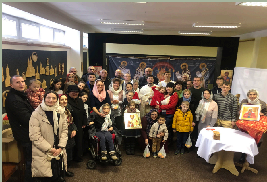
Oslavy chrámového sviatku sv. Nikolaja, myrliktijského divotvorcu, v Liptovskom Mikuláši