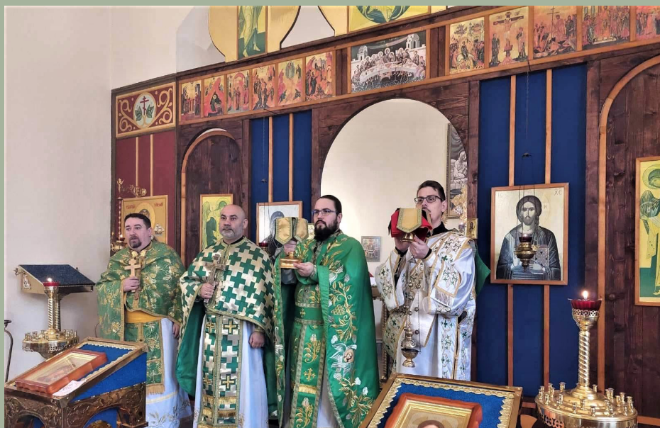
Oslavy sviatku sv. Jonáša Kyjevského v chráme Narodenia Presvätej Bohorodičky v Cejkove