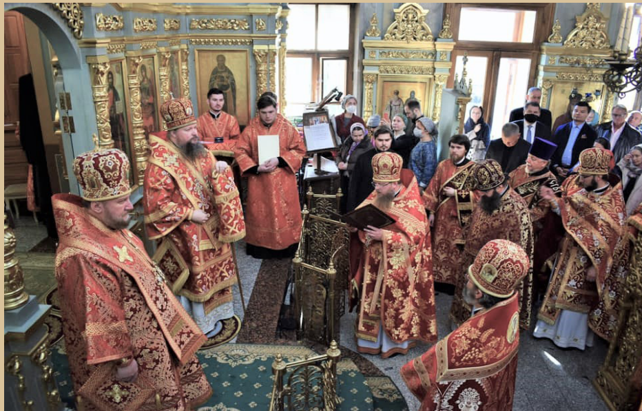
Oslavy sviatku sv. Eudmily Českej v chráme sv. Nikolaja Divotvorcu v Kotelníkách pri Zastupiteľstve Pravoslávnej cirkvi v českých krajinách a na Slovensku v Moskve