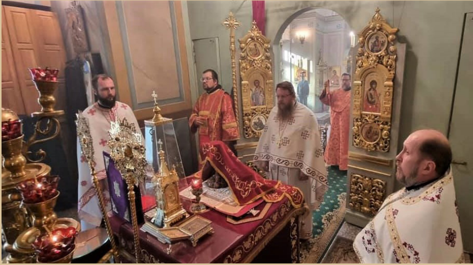
Oslavy sviatku sv. Václava Českého v chráme sv. Nikolaja Divotvorcu v Kotelníkách pri Zastupiteľstve Pravoslávnej cirkvi v českých krajinách a na Slovensku v Moskve